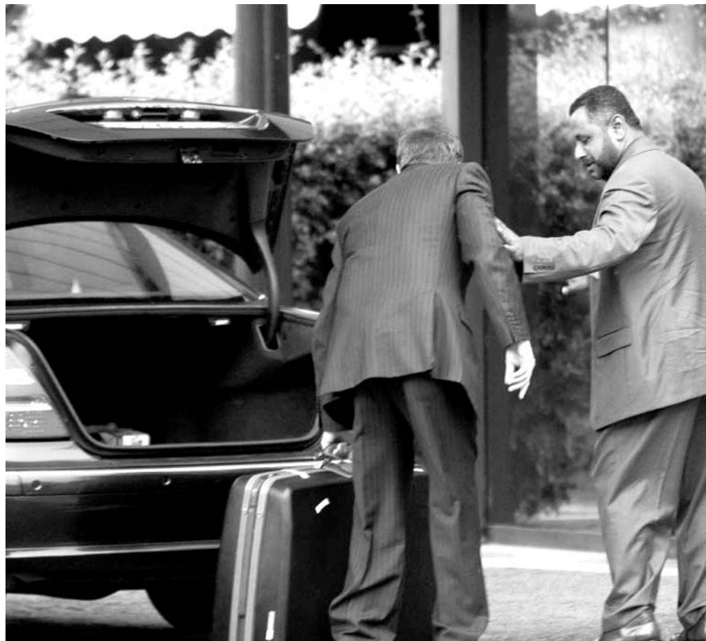
Il seguito del sultano fa le valigie: è finita la vacanza barese del monarca.

Il monarca fa le valigie e prepara il decollo: lascerà Bari oggi