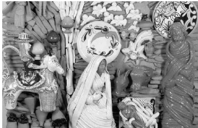
Un presepe ceramico di Grottaglie. È questo il modello al quale si è ispirato l'artista che ha realizzato i tre Re magi donati dal presidente della Regione Nichi Vendola al sultano dell'Oman

Per il sindaco Bagnardi la distanza che separa Grottaglie dal lontano sultanato è solo appa-