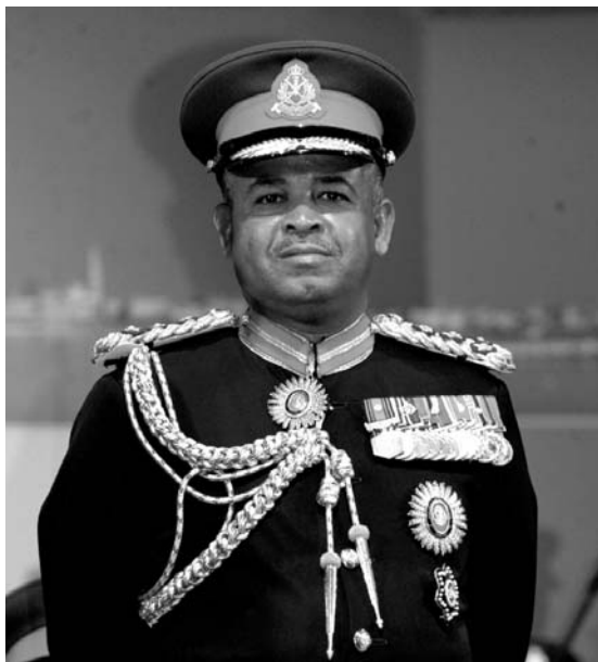
Il direttore della banda della Guardia reale

LE OPERAZIONI. Da ieri è cominciato un continuo via vai di tir in partenza dal porto verso l'aeroporto